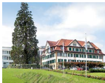
Hirslanden AndreasKlinik, Cham Zoug