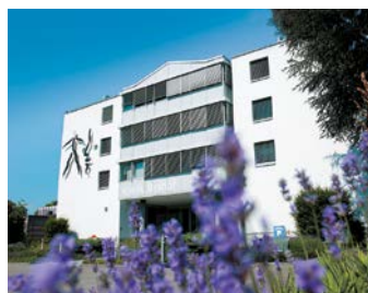
Hirslanden Klinik Birshof, Münchenstein Bâle