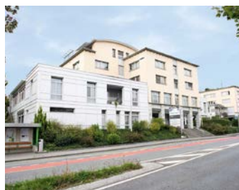
Hirslanden Klinik Meggen