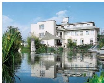
Hirslanden Salem-Spital, Berne