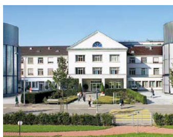
Hirslanden Klinik Hirslanden, Zurich