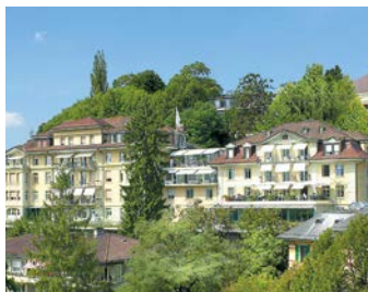
Hirslanden Klinik Beau-Site, Berne