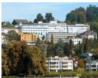
Hirslanden Klinik St. Anna, Lucerne