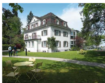
Hirslanden Klinik Belair, Schaffhouse