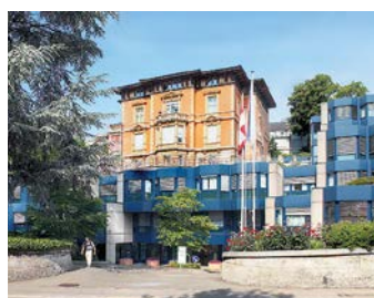
Hirslanden Klinik Im Park, Zurich