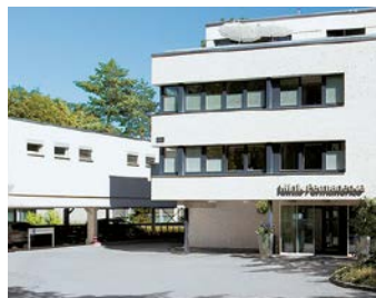
Hirslanden Klinik Permanence, Berne