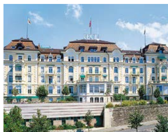
Hirslanden Clinique Cecil, Lausanne