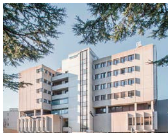
Hirslanden Clinique Bois-Cerf, Lausanne