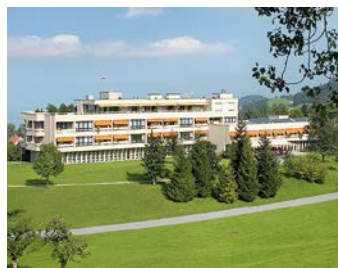
Hirslanden Klinik Am Rosenberg, Heiden