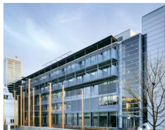
Hirslanden Klinik Aarau